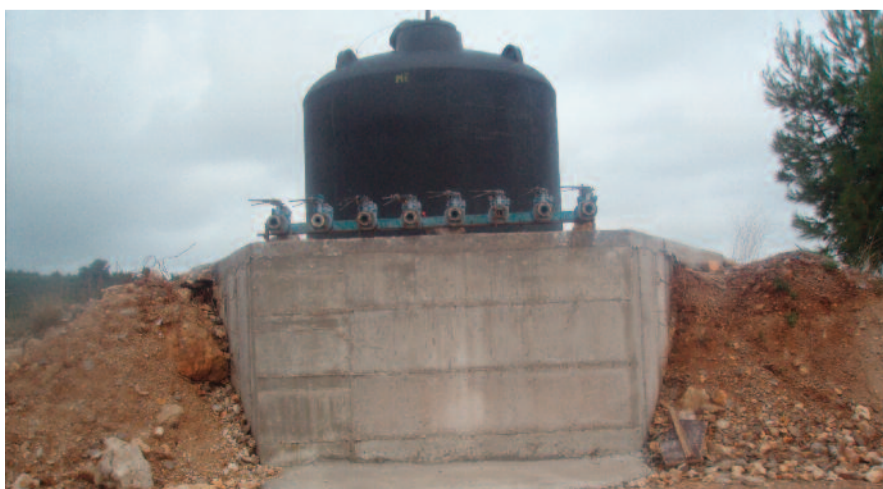
Η ποτίστρα στη διασταύρωση του Μαρτίνου