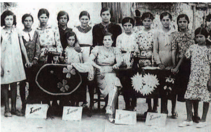
ΣΧΟΛΗ ΚΕΝΤΗΜΑΤΟΣ ΜΑΡΤΙΝΟΥ [1938]