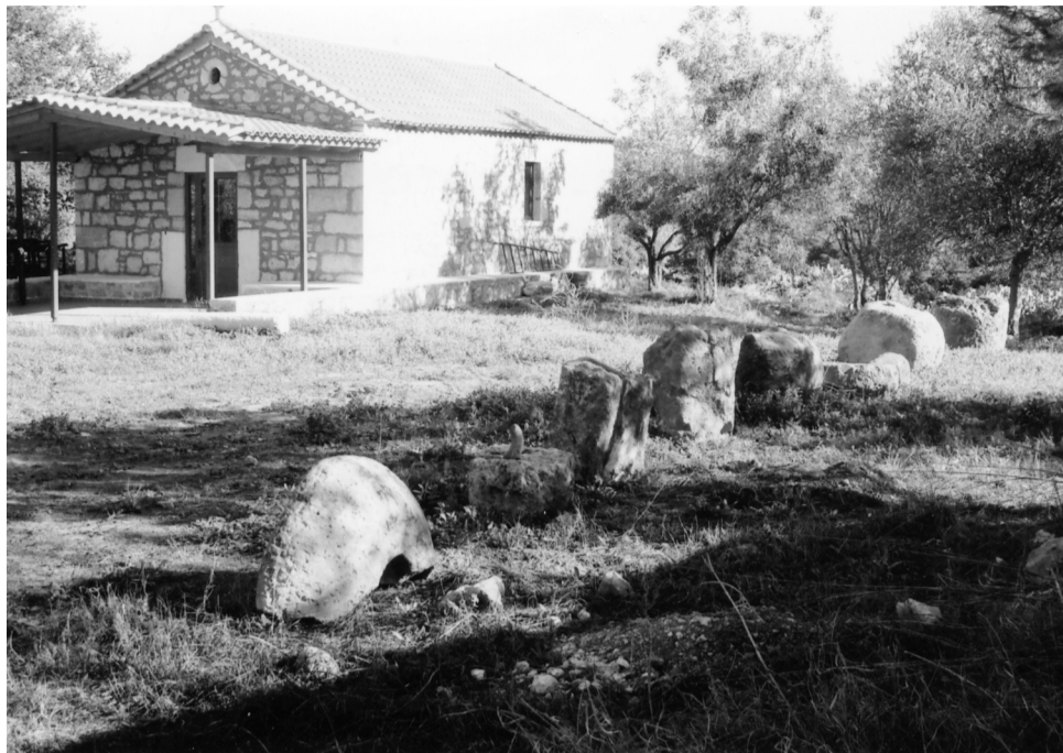
Παλιοχώρι Μαρτίνου ή Βουμελιταία. Ναός Αγ. Γεωργίου, Ληνοί, Δόμοι, Μυλόπετρες, λίγα απομεινάρια των αρχαίων προγόνων μας.

Το κείμενο αυτό ενισχύει την θέση της Βουμελιταίας στο Παλιοχώρι του Μαρτίνου γιατί το Παλιοχώρι κι η Λάρυμνα είναι οι δύο συνοριακές πόλεις με την Βοιωτία που εισχωρούσαν στο κοινό των Βοιωτών όταν την ηγεμονία είχαν η Θήβα και ο Ορχομενός (Μινύες) αλλά και τα 2 κόκκινα αγάλματα από το Παλιοχώρι του Μαρτίνου στο μουσείο της Θήβας είναι από Βοιωτικά εργαστήρια. Τα δύο παραπάνω κείμενα καθορίζουν την θέση της αρχαίας Βουμελιταίας στο Παλιοχώρι του Μαρτίνου αλλά όχι μόνο απορρίπτουν και άλλες πιθανές θέσεις που είχαν ειπωθεί κατά καιρούς όπως Προσκυνάς που ταυτίζεται με την αρχαία Κορσεία, Μαλεσίνα δεν στοιχειοθετεί ύπαρξη αρχαίας πόλης αλλά μικρού οικισμού, Κυπαρίσι ταυτίζεται με τον Οπούντα. Επίσης το αρχαίο κείμενο απορρίπτει και την θέση στην Βρύση του Μοναχού στην Φουνταριά στις εσχαιές του Δήμου Οπουντίων στα σύνορα με τον Παύλο και το Λούτσι.