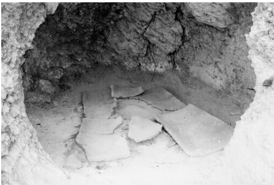
Οι κοίλες κεραμίδες που είχαν τοποθετηθεί οι νεκροί

στην φονική μάχη του 86 π.Χ. από την οποία όπως θα γράψουμε σε άλλο τεύχος της εφημερίδας επήλθε και η καταστροφή της Λάρυμνας των Αλών (Θεολόγος) και της Ανθηδώνας. Μερικά ερωτήματα που μας βασανίζουν για τους αρχαίους προγόνους μας στο ΠΑΛΙΟΧΩΡΙ ΜΑΡΤΙΝΟΥ ίσως απαντηθούν εν καιρώ από την ΙΔ' Εφορεία Αρχαιοτήτων καθώς συλλέχθηκαν τα οστά των νε-