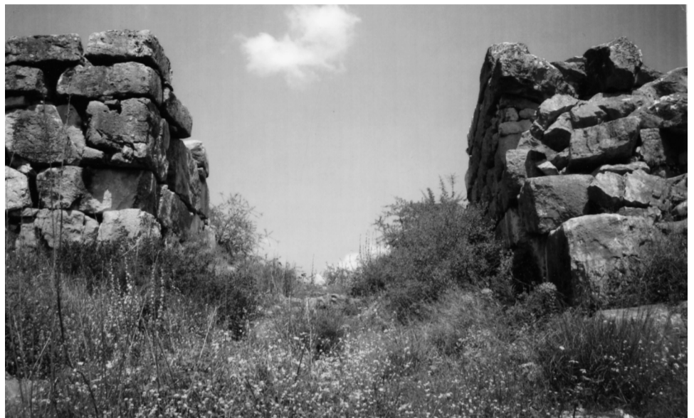
ΓΛΑΣ. Νότια κύρια πύλη Μυκηναϊκή Ακρόπολη των Μινύων

Το πρώτο συνέδριο ναυτικών κρατών όπου συζητήθηκε το πρόβλημα του ανταγωνισμού στο Αιγαίο από τα τρωικά πλοία, έγινε στο παλάτι του Μινύα στον Ορχομενό και η φιλοξενία του στους υψηλούς αρχηγούς των πλουσιών κρατών ήταν τέτοια που ο νεαρός τότε Αγαμέμνωνας έμεινε κατενθουσιασμένος και χάρισε στον Ορχομενό τον καλλιμάρμαρο ναό της Αργυνίδος Αφροδίτης. Όλος αυτός ο μεγάλος στόλος