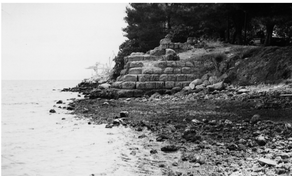
Ταρσανάς Λάρυμνας (Αμψιτίς) Πύργος οχύρωσης

Η Λάρυμνα κατά την αρχαιότητα ήταν ένα εμπορικό και στρατιωτικό λιμάνι, επίσης υπήρχαν ναυπηγεία στον ανατολικό κόλπο δίπλα στην Ακρόπολη που και σήμερα λέγεται Ταρσανάς, που σημαίνει ναυπηγεία. Η είσοδος του κόλπου των ναυπηγείων