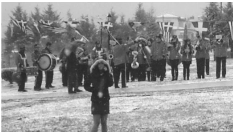
Η μπάντα του Δήμου Λοκρών κάτω από αντίξοες καιρικές συνθήκες

Κλείνοντας θα αναφέρω και τούτο: Ενώ ο εορτασμός για τα αποκαλυπτήρια κυλούσε με την μεγαλοπρέπεια που αρμόζει σε αυτή την εθνικής σημασίας γιορτή, δυστυχώς δεν έλειψε και το παρα-