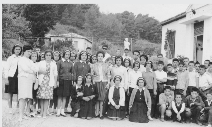
1965 Γυμνάσιο Μαρτίνου εκδρομή στην Επίδαυρο